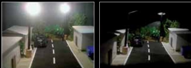
Simulación de la vista lateral de un alumbrado no adecuado en comparación con un alumbrado correcto que demuestra el impacto reflejado a nuestros ojos

Es indudable que el alumbrado exterior es un logro que hace posible desarrollar múltiples actividades en la noche, pero es imprescindible iluminar de forma adecuada, evitando la emisión de luz directa a la atmósfera y empleando la cantidad de luz estrictamente necesaria allí donde necesitamos ver. Toda luz enviada lateralmente, hacia arriba o hacia los espacios en donde no es necesaria no proporciona seguridad ni visibilidad y es un desaprovechamiento de energía.