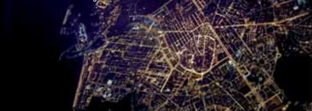
Imagen aérea nocturna de la ciudad de Valencia

Estos perjuicios no se limitan al entorno del lugar donde se produce la contaminación -poblaciones, polígonos industriales, áreas comerciales, carreteras, etc.-, sino que la luz se difunde por la atmósfera y su efecto se deja sentir hasta centenares de kilómetros desde su origen.