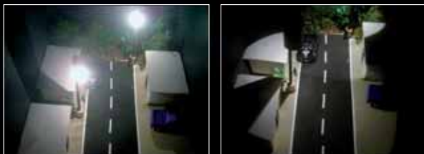
Simulación de la vista superior de un alumbrado no adecuado en comparación con un alumbrado correcto

La contaminación lumínica se define como la emisión de flujo luminoso de fuentes artificiales nocturnas en intensidades, direcciones, rangos espectrales u horarios innecesarios para la realización de las actividades previstas en la zona en la que se instalan las luces.